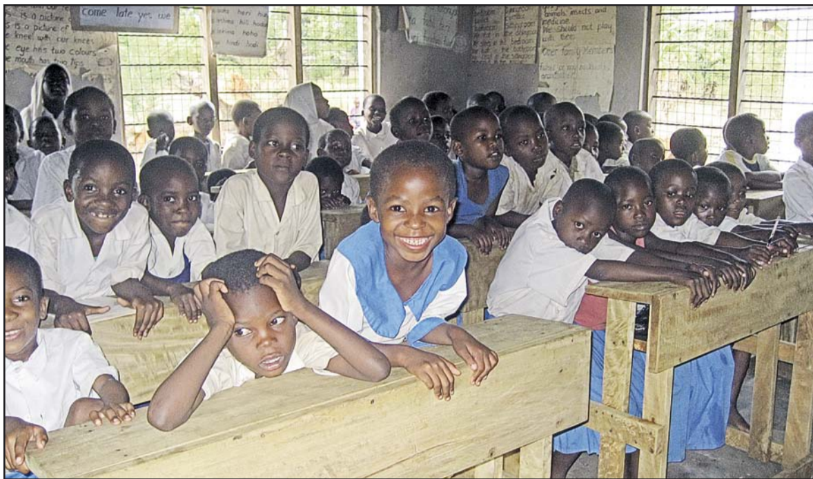
Als sie ihre ersten Schulbänke hatten, haben sich die Kinder in Ukunda sehr gefreut.