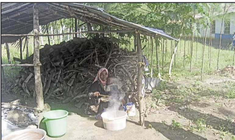
Gekocht wird draußen, hier für den Kindergarten in Ukunda.

Ein besonderer Luxus ist es, wenn man eine Nähstube hat. Die dort hergestellten Kleidungsstücke werden