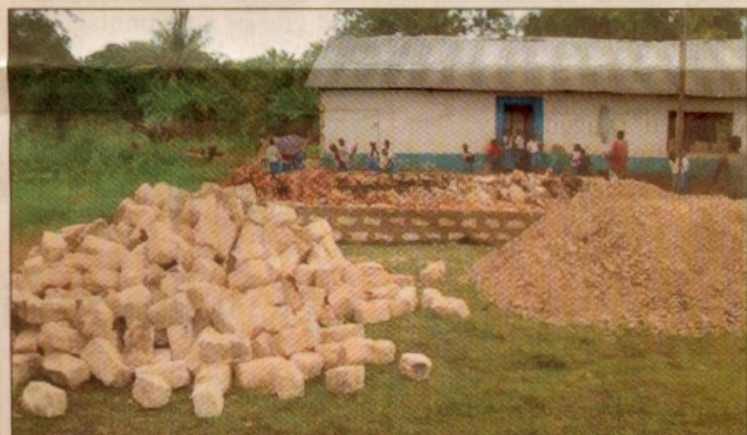
Die Spenden ermöglichten, mit dem Bau eines weiteren, dringend benötigten Schulraums beginnen zu können.